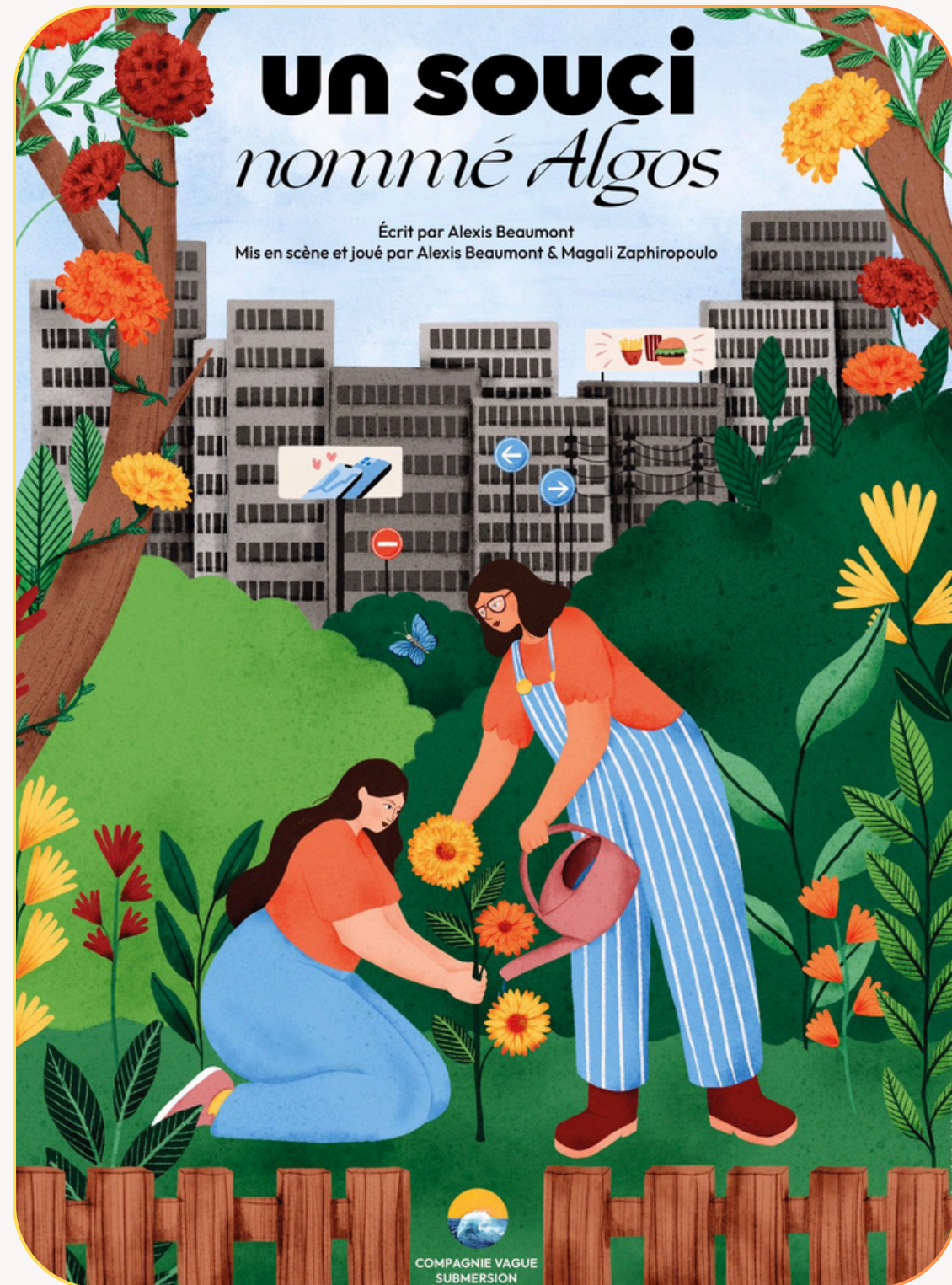
Affiche réalisée par Anaïs Sanchez

« On va prendre de l'espace, respirer un bon coup... »